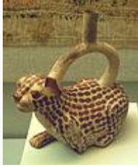
Jaguar. Cerámica pictórico-escultórica zoomorfa.