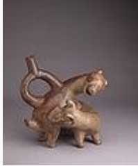
Llamas en cópula. Museo Larco.