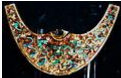
Orfebrería mochica. Nariguera con incrustaciones de turquesa.