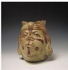
Varón con tocado y pintura facial.