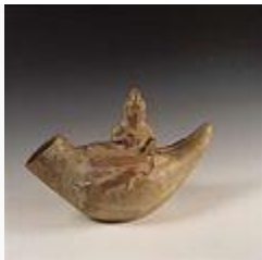
Pescador mochica en embarcación denominada «caballito de totora».