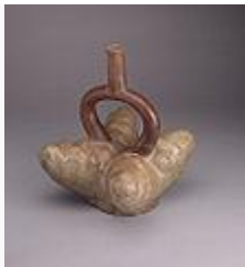
• Representación mochica del tubérculo denominado papa.