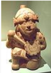
Guerrero mochica genuflexo con armas.