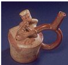
Cerámica erótica mochica. Felación.