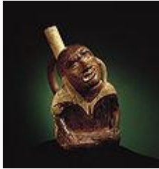
Cerámica escultórica. Varón con parálisis facial.