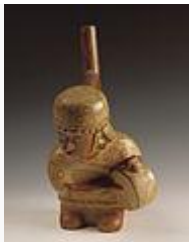
Músico mochica con tambor.