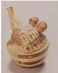
• Arte erótico mochica.