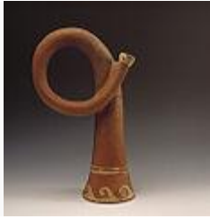
Trompeta de cerámica mochica.