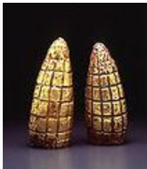
Metalurgia mochica. Maíz