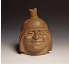
• Huaco retrato. Varón sonriendo.