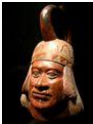
Huaco retrato. Varón con tocado.