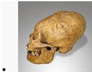
Cráneo deformado perteneciente a la cultura Nazca.