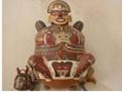
Cerámica escultórica Nazca.