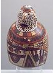
Vasija pictórica de factura Nazca.