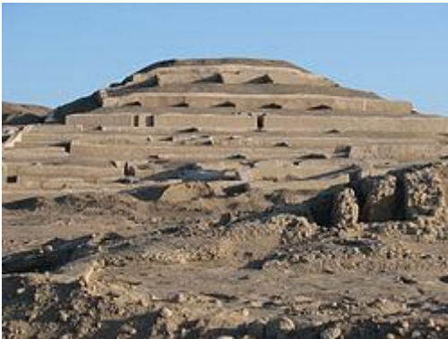
Complejo arqueológico de Cahuachi, atribuido a la cultura Nazca.

Los nazcas utilizaron como principal técnica el adobe. Destaca el complejo arqueológico de Cahuachi, a orillas del Río Grande, con su templo de corte piramidal, de terrazas superpuestas, y su palacio de los jefes guerreros, en medio de seis barrios o complejos arquitectónicos bien definidos. Debió ser el principal centro administrativo y de culto de los Nazca. Otros centros urbanos nazcas fueron Tambo Viejo, Huaca del Loro y Pampa de Tinguíña.