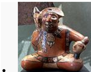
Representación de un guerrero sosteniendo una cabeza trofeo