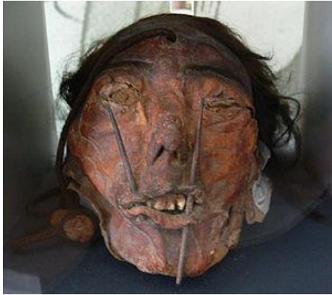
Cabeza trofeo de la cultura Nazca.

Algunas costumbres de los nazcas fueron las siguientes: