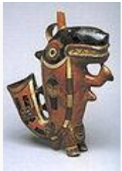
Figura zoomorfa. Orca mítica.