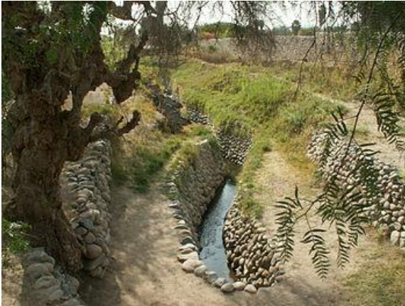
Canal de riego Nazca.

La tecnología se desarrolló principalmente en el ámbito agrícola, aplicando la ya mencionada ingeniería hidráulica para la construcción de un excelente sistema de acueductos, canales y pozos, con la finalidad de abastecer de agua los terrenos de cultivo de manera permanente. Estos “canales de irrigación” todavía están en uso.