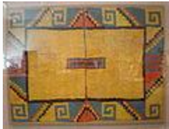
Arte plumario de la cultura Nazca.