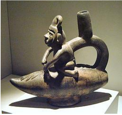
Cerámica chimú: Pescador en un caballito de totora (1100–1400 d. C.).

Los cerámicos chimúes cumplieron dos funciones, como recipientes para uso diario o doméstico y los cerámicos de uso ceremonial o para ofrendas de los entierros; los primeros fueron elaborados sin mayor acabado mientras los funerarios muestran bastante dedicación. Las principales características de las vasijas chimúes son una pequeña escultura en la unión del gollete con el arco, su fabricación moldeada para la cerámica ceremonial y modelada para uso diario, su coloración generalmente negro metálico con algunas variantes, su brillo característico se obtenía humeando la vasija que previamente había sido pulida. En pequeñas cantidades también se elaboraron cerámicos de colores claros. En la cerámica se han plasmado muchas representaciones realistas como animales, frutos y personajes, así como, escenas místicas y eróticas.